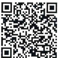
หนังสือโครงการ

จึงเรียนมาเพื่อโปรดประชาสัมพันธ์โครงการและพิจารณาส่งบุคลากรในสังกัดเข้าร่วมโครงการฝึกอบรมดังกล่าว